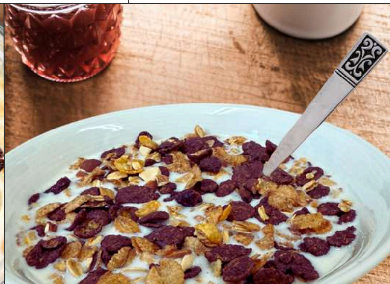
日食 ビターグラノーラ