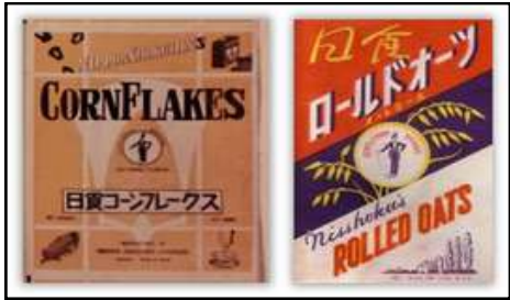
昔のコーンフレーク・オートミール