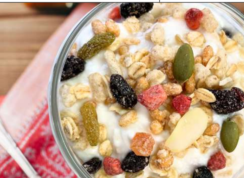
日食 ふわサクフルーツ&ナッツ グラノーラ

オーツ麦と北海道産大麦と北海道産てんさい糖 に4種類の乾燥果実を贅沢に配合し、油分を使 用せずに焼き上げた、オーツ麦を主体とした噛 ごたえのあるグラノーラです。