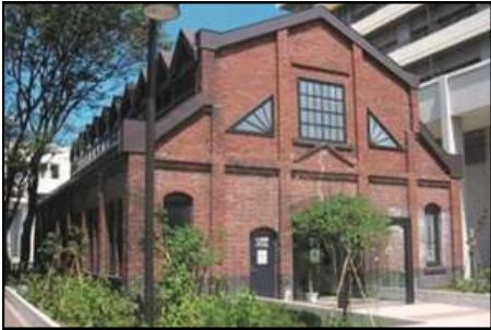
現在はJR琴似駅前 コミュニティスペースとして利用