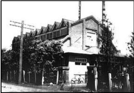
1929年に建てられた弊社工場